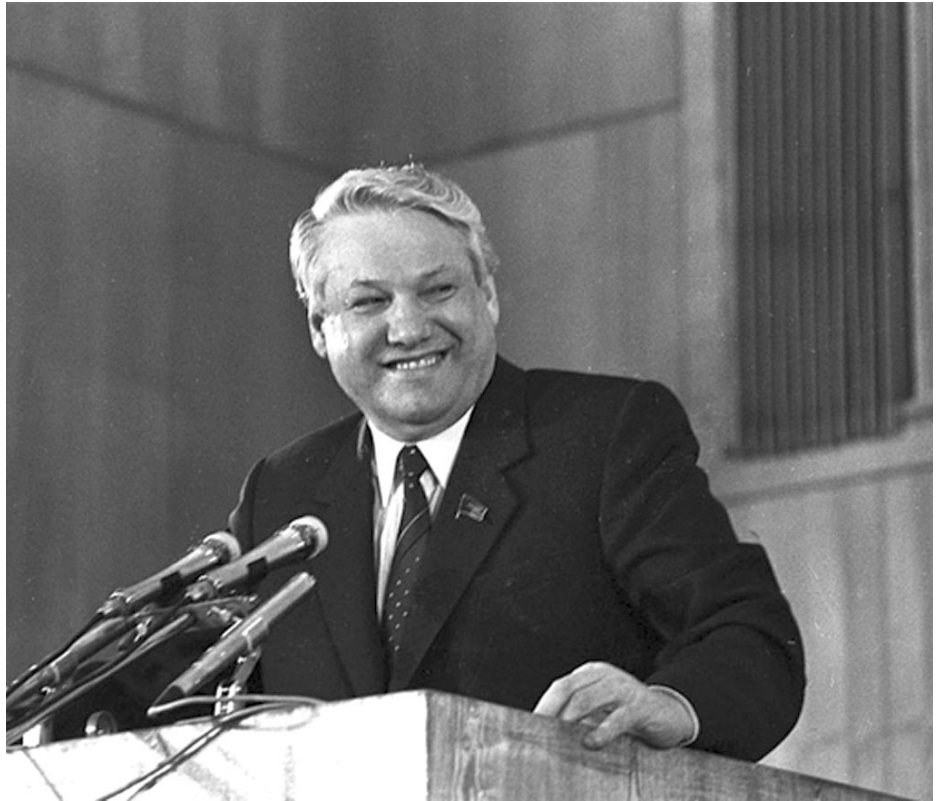
BORISZ JELCIN RÁÉRZETT A RENDSZERVÁLTÁSRA

Az új parlament csak látszólag szolgálja a szocializmust. A valóságban Gorbacsov megszűnteti a kommunista párt vezető szerepét, amit majd 1990-ben deklarálnak is. A Szovjetuniót kvázi többpárti rendszerű országgá alakítja. Ez persze még nem az igazi tőkés többpártrendszer, de a lényeg megvan: az SZKP-t megfosztják vezető szerepétől. Gorbacsov fokozatosan felszámolja a szocializmusra jellemző tervgazdaságot, és beengedi a piacot. A piac viszont nem szocialista kategória, hanem a kapitalizmus szabályai szerint működik. Gorbacsov tudja azt is, hogy a modern média milyen szerepet játszik, ezért a médiát a glasznosztly politikája alapján fokozatosan átjuttatja a tőkés