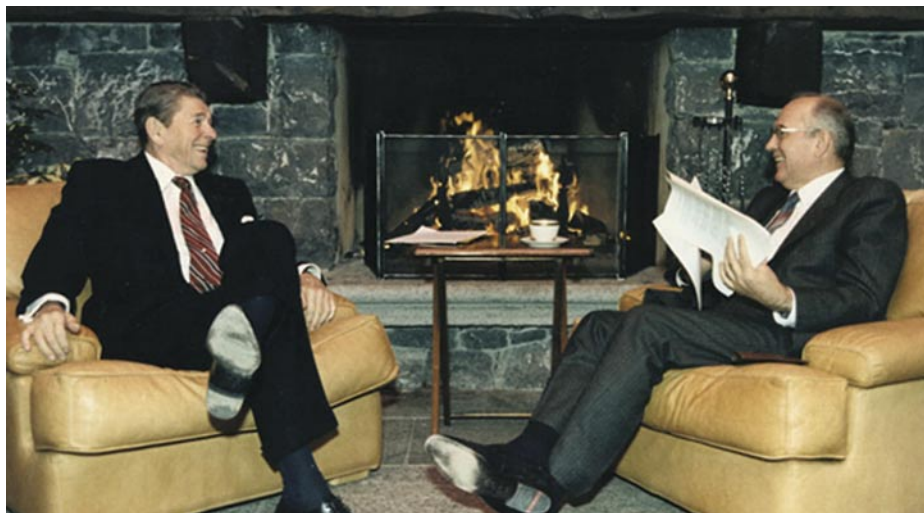
RONALD REAGAN AMERIKAI ELNÖK ÉS MIHAIL GORBACSOV. A SZOVJET FŐTITKÁR MEGKEZDTE HAZÁJA ELADÁSÁT

Az amerikai imperializmus a kelet-európai országokban a békés rendszerváltás